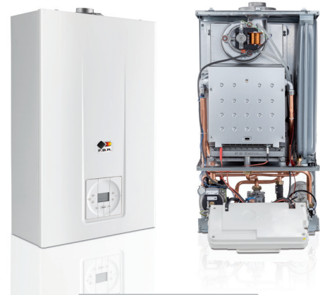
Mod. SPRING 24 E2

A richiesta: sistema di controllo remoto a distanza e sonda esterna per regolazione climatica